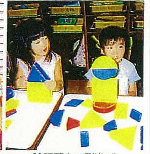
論理積木で形遊び