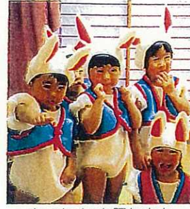
ちいさくても踊れます