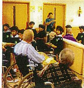
特別養護老人ホーム訪問