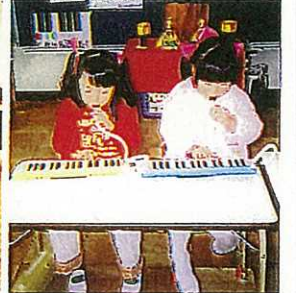
ドレミの音が吹けました