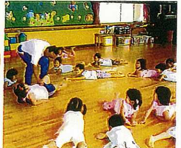
カワイ体操教室の先生による楽しい体育遊び