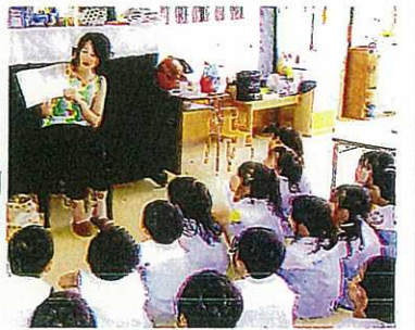
嬉しいお母さんの読み聞かせ