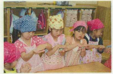
(お団子ころころ、よもぎ団子作り)