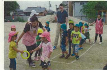
(みんなで リレーごっこ)