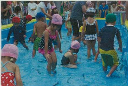
(ますのつかみどり)