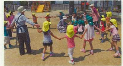
(地域の人と遊ぼう・あぶくたった)